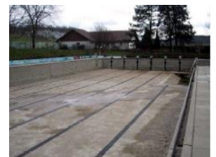
...das Schwimmbad Embrach vor der Sanierung...