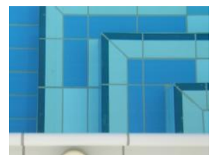
...das Schwimmbad Embrach nach der Sanierung... jeder Stein, jedes Detail gehört zum Gesamtkonzept

Hunziker Betatech AG Pflanzschulstrasse 17 Postfach 83 8411 Winterthur Tel. 052 234 50 50 Fax 052 234 50 99 www.hunziker-betatech.ch