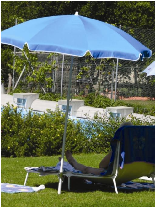
Badeanlagen - eine Wohlfühl-Insel in der Region

Hallenbäder, Freibäder, Wellnessanlagen sind kostenintensive Bauten. Der Bedarf an Energie, Frischwasser und personellen Ressourcen ist gross; hohe Ansprüche an Materialien führen zu kurzer Lebensdauer und einem hohen Instandsetzungsbedarf. In Gemeinden zählen die Bäder zu den teuersten und aufwendigsten Anlagen .