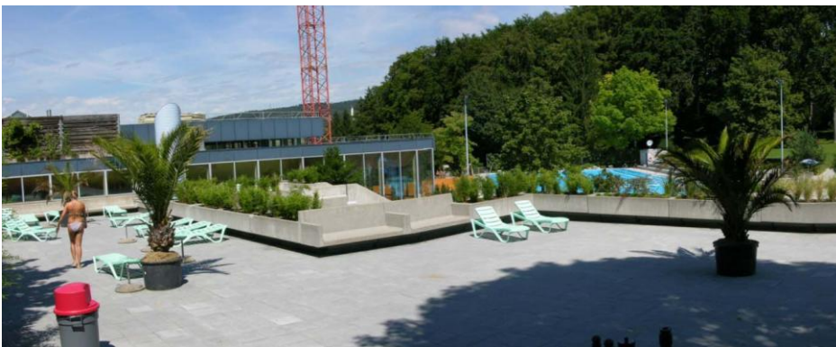
Die Hallen-/Freibadanlage Fohrbach in Zollikon ist ein wichtiges "Erholungsgebiet" der Region