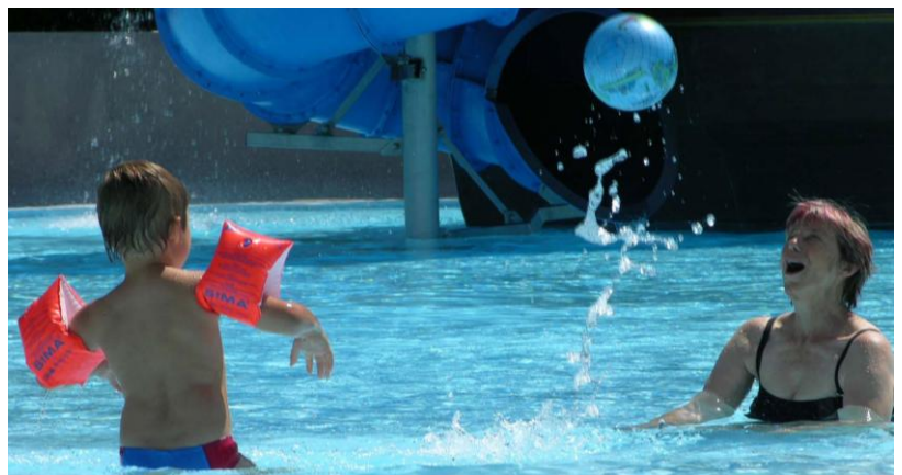
Qualität und Sicherheit im Schwimmbadbereich sind bei uns gross geschrieben