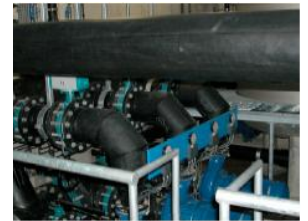
Auch die Innereien des Bades liegen uns am Herzen