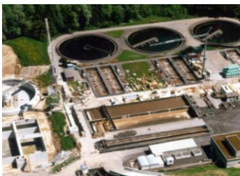
ARA Au St. Gallen, 66'000 EW