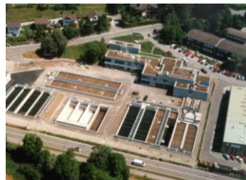
ARA Flos, Wetzikon, 37'000 EW