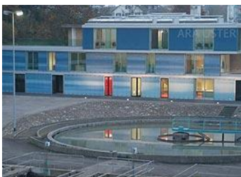
ARA Uster, 48'000 EW