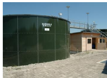
ARA Gütighausen, 1'500 EW

Hunziker Betatech AG Pflanzschulstrasse 17 Postfach 83 8411 Winterthur Tel. 052 234 50 50 Fax 052 234 50 99 www.hunziker-betatech.ch